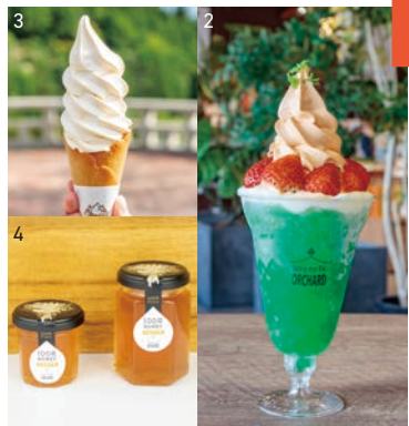
1. 享受舒適溫暖時光樂趣的圓頂型帳篷。2. 時鮮水果豐富的ORCHARD芭菲※內容因季節而異。3. 伴入八天堂自做的蛋奶凍的軟冰淇淋。4. 三原和世羅地區的生產者和企業共同打造的原創商品。

銷售以水果為主題的當地產三原和世羅地區的特產和原創甜點。在設施前的草坪區，夏天設置遮陽布，冬天設置圓頂帳篷座席，可以點買推薦的水果三明治、芭菲、飲料菜單等在室外享樂。在天空下和綠色環繞的空間，品嚐豐富的甜點度過優雅的喝咖啡時間。還定期舉行展銷會和商品銷售活動。