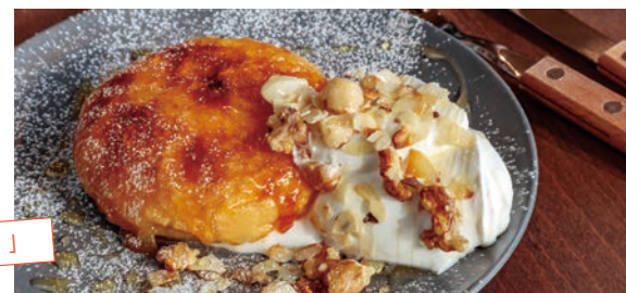
咖啡館最有人氣的「楓糖堅果法式土司」