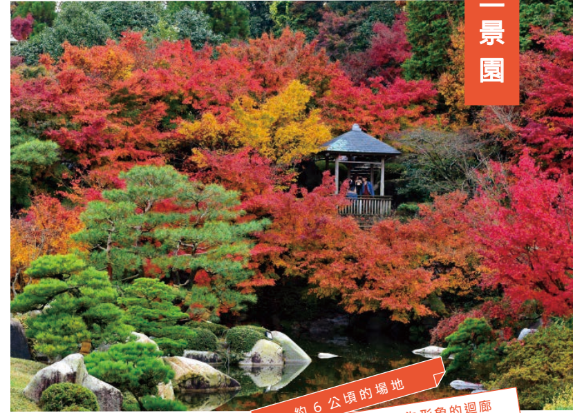
約 6 公頃的場地 以嚴島神社為形象的迴廊