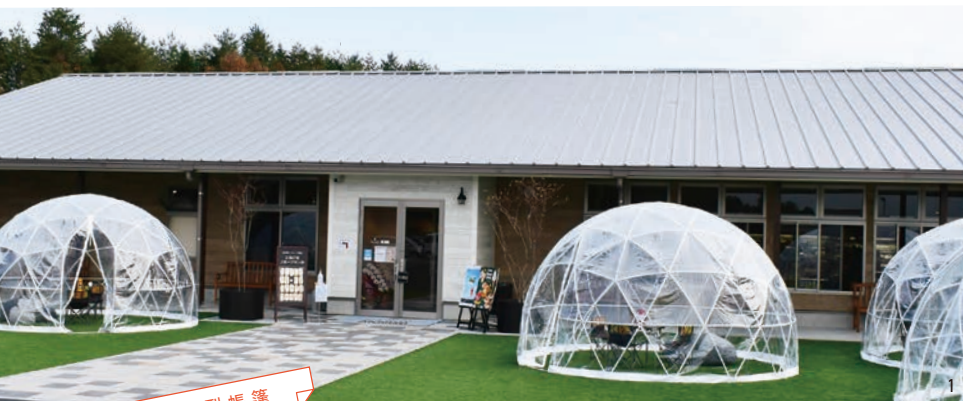
漂亮的圓頂型帳篷