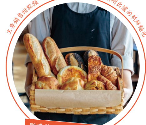
主要販售甜點類、麵包、長條麵包等硬質類剛出爐的新鮮麵包