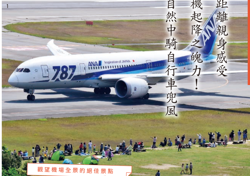
觀望機場全景的絕佳景點