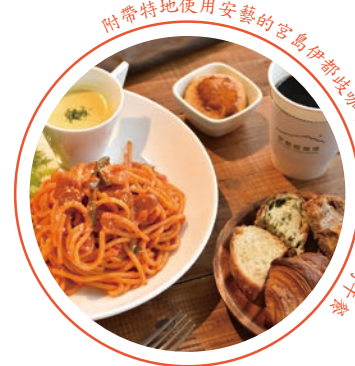
附帶特地使用安藝的宮島伊都波咖啡做成咖啡及甜點的午餐