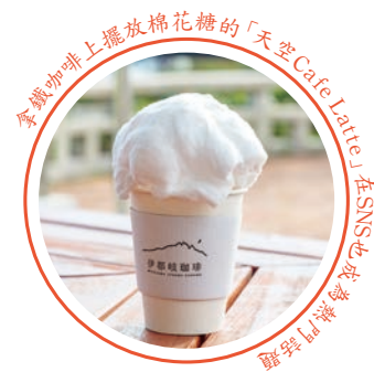
拿鐵咖啡上擺放棉花糖的「天空Cafe Latte」在SNS上也成為熱門話題