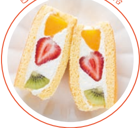
色彩鮮豔的水果三明治