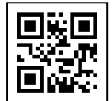
RUNNET QR コード

※参加者が未成年の場合は保護者の方が必ず同意書を必ずお読みになり、当日までに署名済の 同意書をご提出ください。