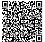
【申込フォームQRコード】