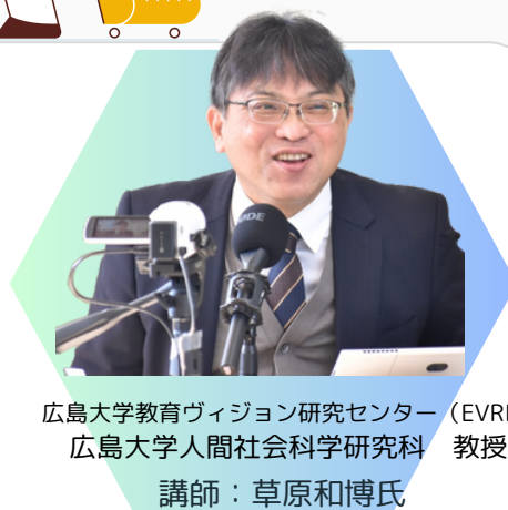
広島大学教育ビジョン研究センター（EVRI） 広島大学人間社会科学研究科 教授